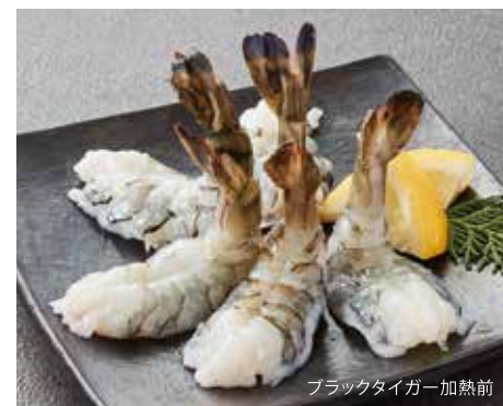
ブラックタイガー加熱前