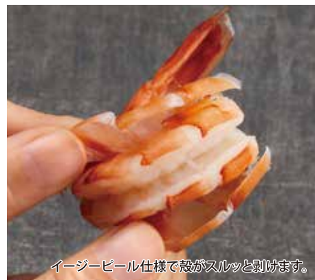
イージーピール仕様で殻がスルッと剥けます。