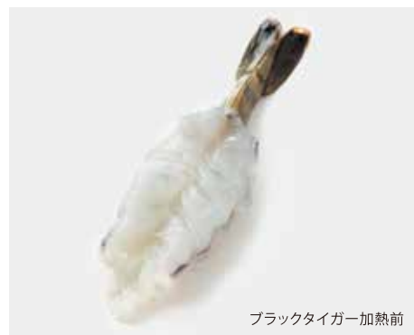
ブラックタイガー加熱前